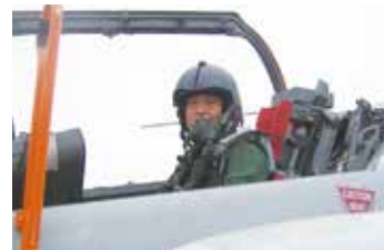
(データ収集のため航空機に同乗)

また、装備品の開発は防衛産業の協力なくして行えるものではありません。そのため、企業と航空自衛隊双方をつなげる貴重なパイプ役になることもできます。技術航空幹部の活躍の場は広がってきています。新しい世界に挑戦してみてください。